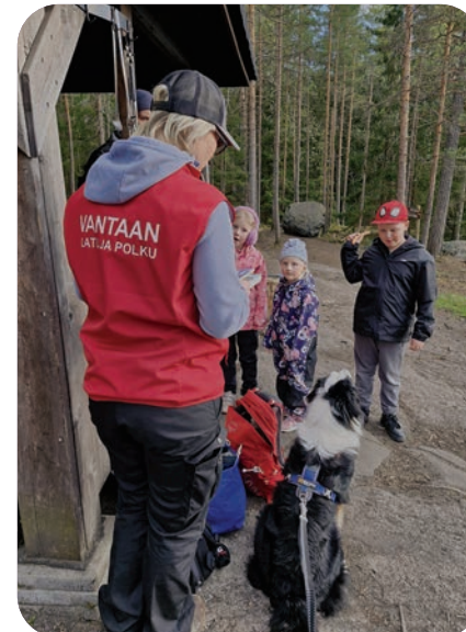
Unelmien liikuntapäivän iltapalaretki innosti lapsia liikkumaan ja leikkimään.