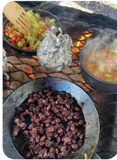
Retkikokkailijat loihdivat herkkuja kesän retket mielessään.