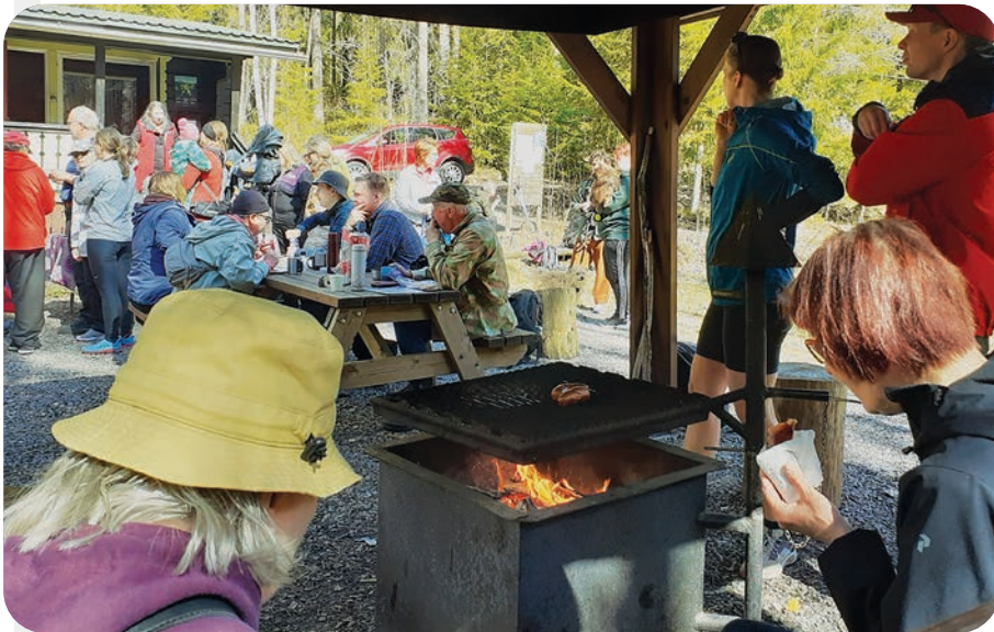
Bisan majalla poikkesi paljon retkeilijöitä kevään polkuretkipäivänä.