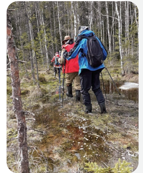
Suokävelijöillä oli Viirilän suolla poikkeuksellisen märkää huhtikuussa.