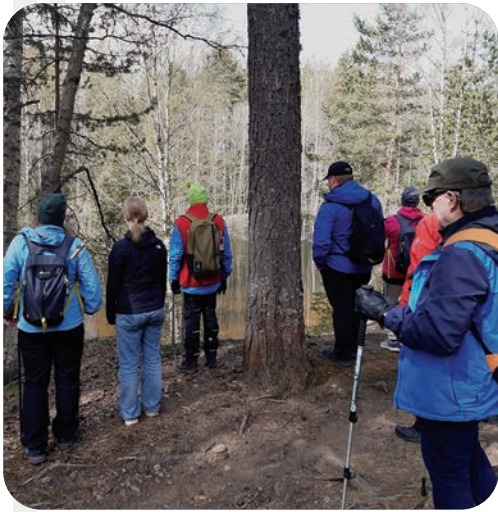
Toukokuussa patikoitiin Petikon luontovirkistysalueen maastoissa.