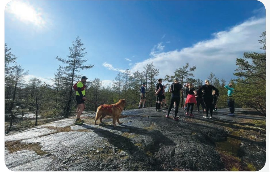
Polkujuoksijat pysähtyivät tauolle Sipoonkorvessa.