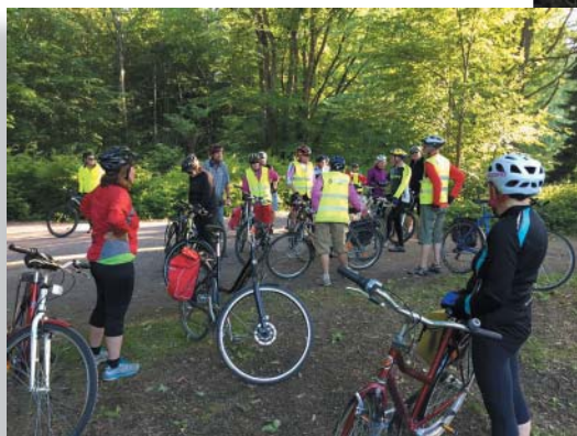
Maanantaipyöräilyt ovat olleet suosittuja.