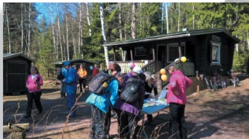
Polkuretkeläisiä Bisan majalla vappuna