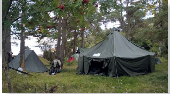
Uudenmaan latualueen Nuku yö ulkona -tapahtumassa Porkkalassa yöpyi reilu sata henkilöä syyskuussa.