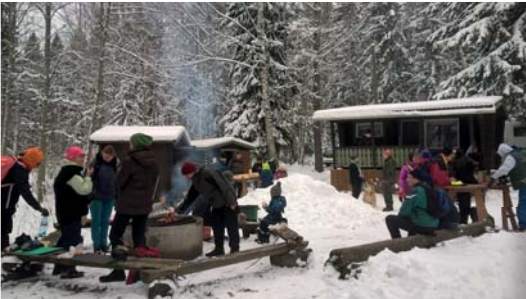
30. isänpäivän polkuretkemme oli kaikenikäisten lumipolkuretki.