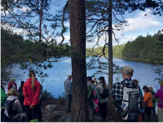
Retkellä Meikon luonnonsuojelualueella Kirkkonummella